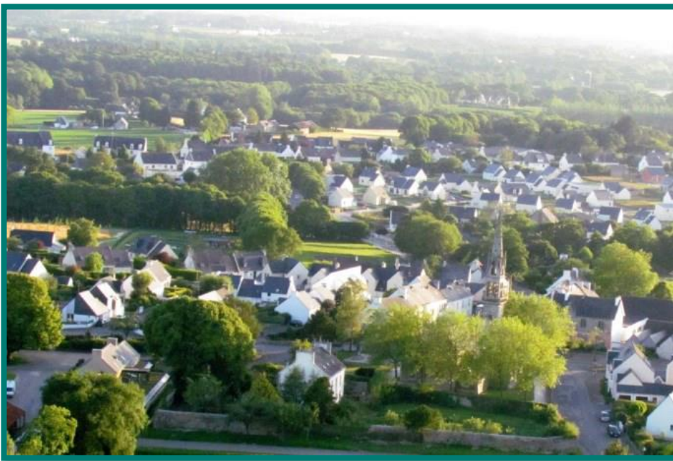
Bourg de Mellac vu d'en haut côté mairie/église/école

Dans un contexte de demande de soins croissante, due notamment à l'augmentation régulière de la population et au départ de confrères sur les communes alentour, 3 médecins seraient aujourd'hui nécessaires pour couvrir les besoins des habitants, que ce soit en installation directe ou pour prendre la suite prochaine d'un praticien sur le départ.