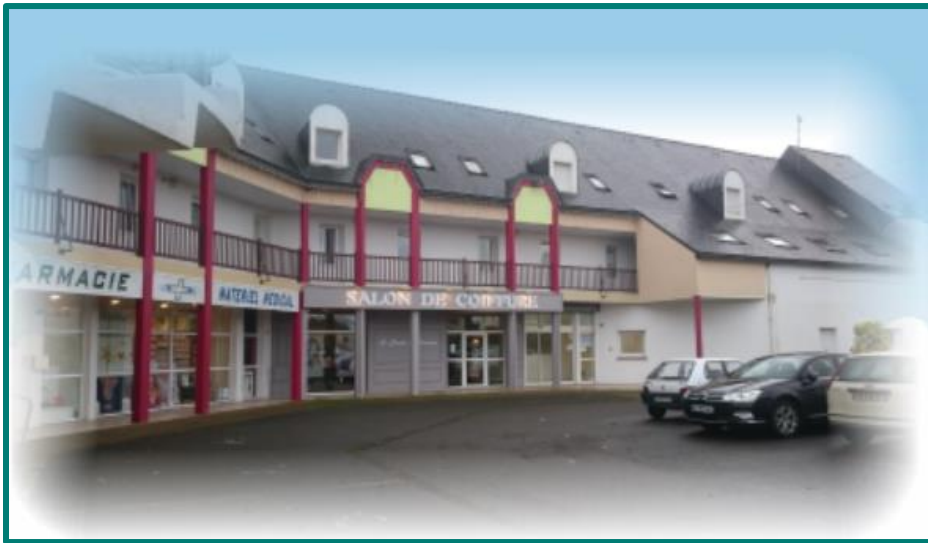
Vue du pôle de santé côté entrée principale, en enfilade du salon de coiffure, au bourg commerçant de Ty Bodel